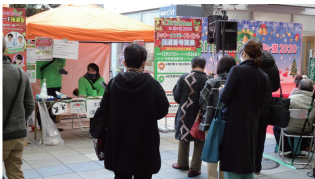
▲掲示したラッキーナンバーを確認する人々