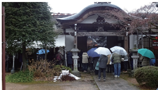
▲焼香の順番を待つ人々

山門をくぐると、護摩供の音が聞こえてきました。大師堂内で行われている声が屋外に設置したスピーカーを通して聞こえるのです。例年は大師堂に入って焼香できるのですが、今年は「3密」を回避するため、堂外の焼香のみの参拝になりました。ご住職も、「今年は『3密』を避けるために堂外での参拝にしました。来年はこんなことにならない年になってほしいものです。」とおっしゃっていました。