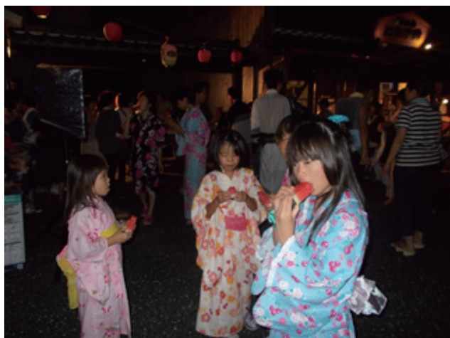
▲踊りの終わりに皆でスイカ