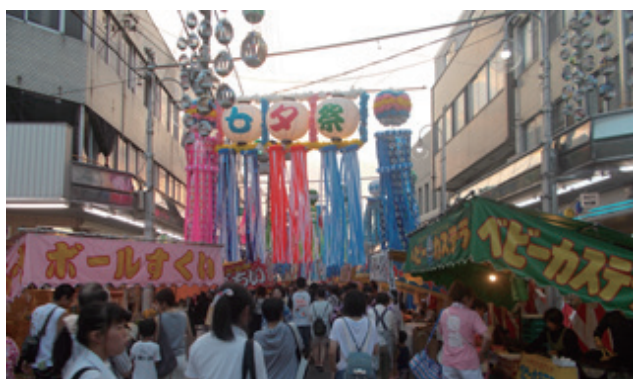
▲吹き流しがきれいな七夕飾り

今年も「絆」がんばろう日本！をテーマに、瑞浪から全国に元気を発信しました。お祭りは、七夕飾り、バサラ踊り、陶土フェスタ、市民祈願花火の4本柱のほかに様々なイベントが開かれ、夕立はありましたが、商店街・市民・参加者のみなさんの熱い気持ちで盛大に盛り上がりました。