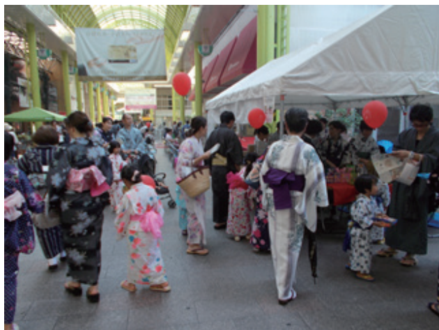
▲スタンプラリーに参加する親子

去年はクイズラリーでしたが、今年はスタンプラリーが行われました。スタンプラリーは、浴衣で参加した人しか抽選会に参加できないルールになっていて、50店舗を5ブ