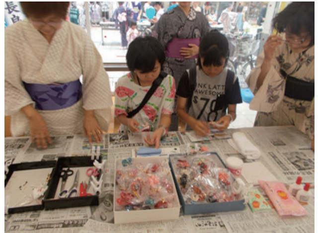
▲携帯ストラップづくり

ロックに分けて、各ブロック3店舗以上のスタンプを集めると抽選会に参加できる仕組みでした。スタンプラリーの参加者は、女性と親子が中心で、子供たちがはしゃぎながらスタンプを押して回っていました。浴衣は、着替えスペースで着付けの無料サービスと浴衣レンタル(下駄つき)が1,000円で実施されました。レンタルの返却期限は花火の時間帯に合わせて翌日まで可となっていました。私も浴衣レンタルを体験させて頂きましたが、親切に着付けをサービスして頂き助かりました。洋服に比べ浴衣と下駄は涼しくてとても快適でした。