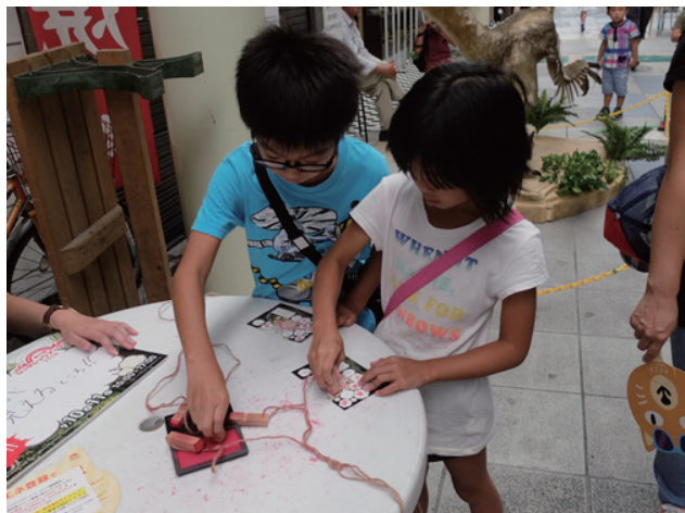
▲スタンプを集める子供たち

リーは、開始前から長蛇の列ができる程の大人気振りでした。私も体験して人気の理由を探ってみました。体験してみたのは、ゴールを目指し