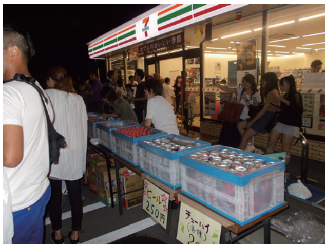
▲メイン会場のコンビニの出店

クの出店を設置する繁盛ぶりでした。商店街の唐揚げ店では、串カツや唐揚げを特価販売して大繁盛していました。唐揚げ店の店主にお話を伺うと、「年に一度の感謝セールだから、これ以上美味しいものはない商品の特価