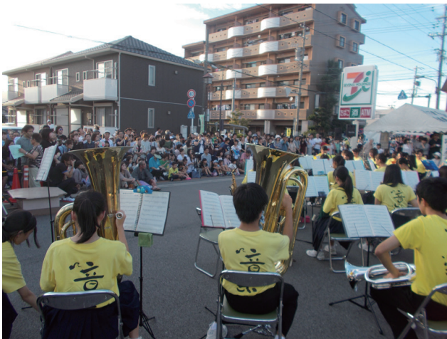
▲蘇原中学校の吹奏楽部演奏に集まる観客

イベントは、各務原太鼓保存会の勇壮な演奏のステージで始まりました。躍動感のある力強い曲や笛を交えた曲に観衆が拍手し、アンコールを求めています。蘇原中学校吹奏楽部の演奏では、観衆が近くで演奏を見よう、我が子の晴れ舞台を撮影しようと、警備の方たちを困らせるほど人が集まっています。消防音楽隊の演奏では、曲と曲の間に短く防災PRを挟んで、市民の防災意識を高めています。