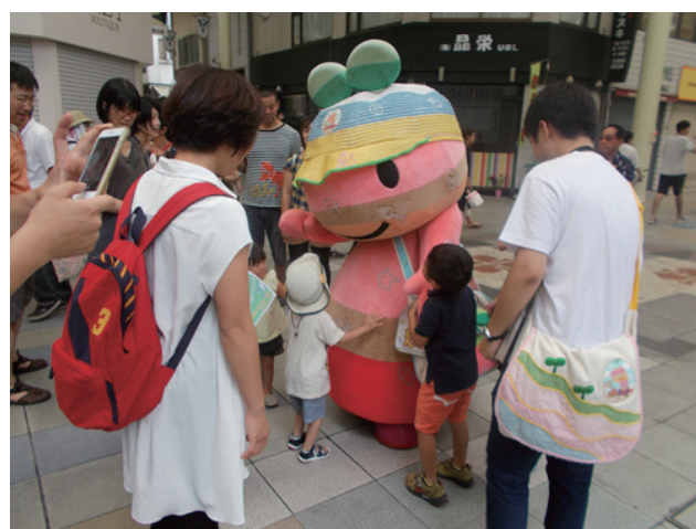
▲子供たちに大サービスのチータン

恐竜繋がり、兵庫県の丹波竜化石工房の出店がありました。丹波のゆるキャラのチータンは、子供たちをなでたり抱いたりするサービスで、集まった子供たちを大喜びさせていました。